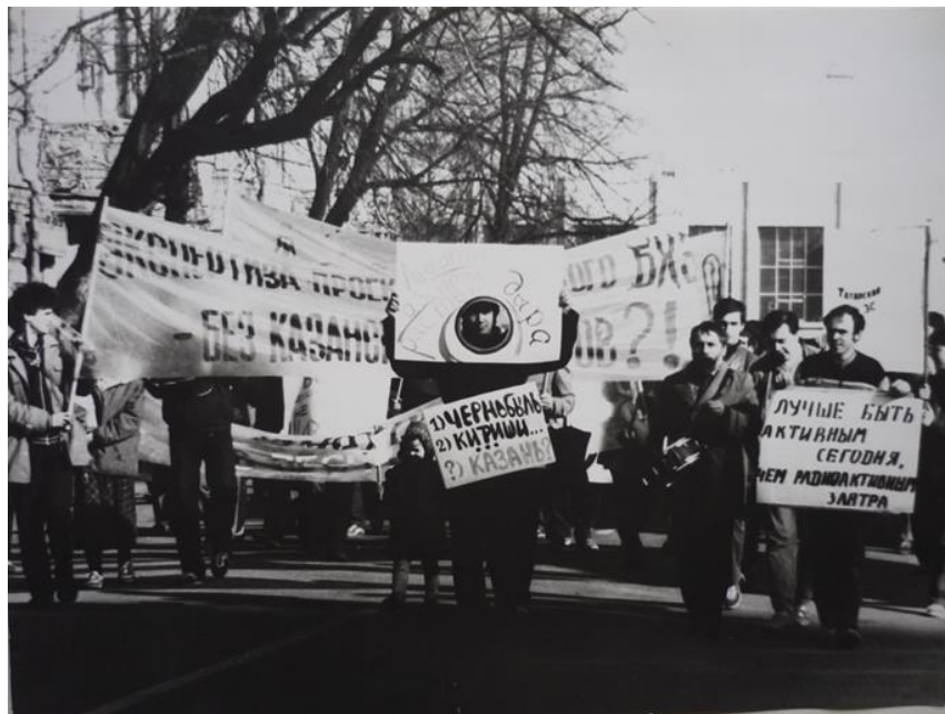
Manifestation d'écologistes à Kazan, 1988. « Mieux vaut être actif maintenant que radioactif plus tard ».

Salle 3.14, PLC 65 rue des Grands Moulins, jeudi 11h-13h – 1 er semestre