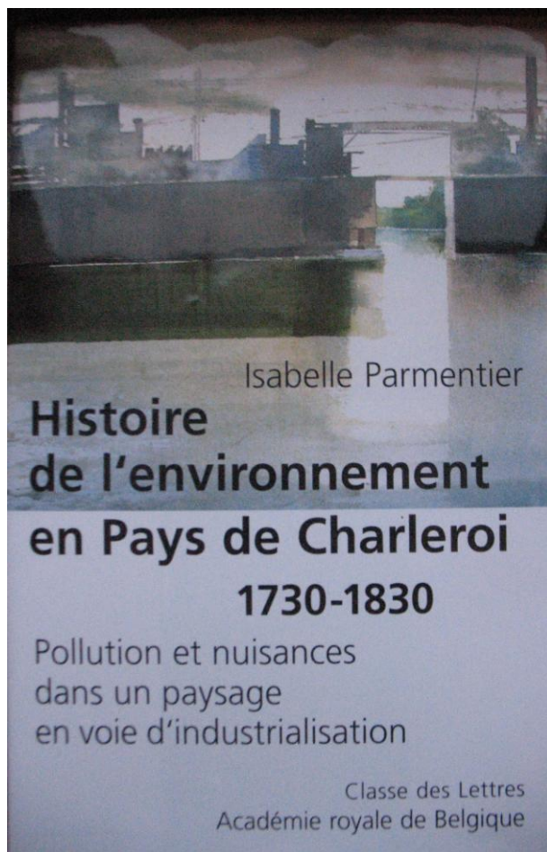
Illustration : « Ouverture vers la Révolution industrielle », aquarelle de Xavier Swolfs, reproduite dans The Tender Passion on Water , Brasschaat, 2005, p. 72. © Xavier Swolfs

Depuis les années septante, la pollution et les nuisances constituent une préoccupation de premier ordre. Les recherches récentes menées en sciences naturelles permettent une meilleure connaissance de l'impact de certaines substances sur l'environnement et sur la santé ; les investigations menées en sciences humaines (que ce soit en psychologie, en ethnologie ou par exemple en philosophie) mettent en lumière les mécanismes de perception, la sensibilité, les attitudes de l'homme produisant ces pollutions et ces nuisances ou soumis à celles-ci. L'histoire a également fait sienne cette préoccupation.