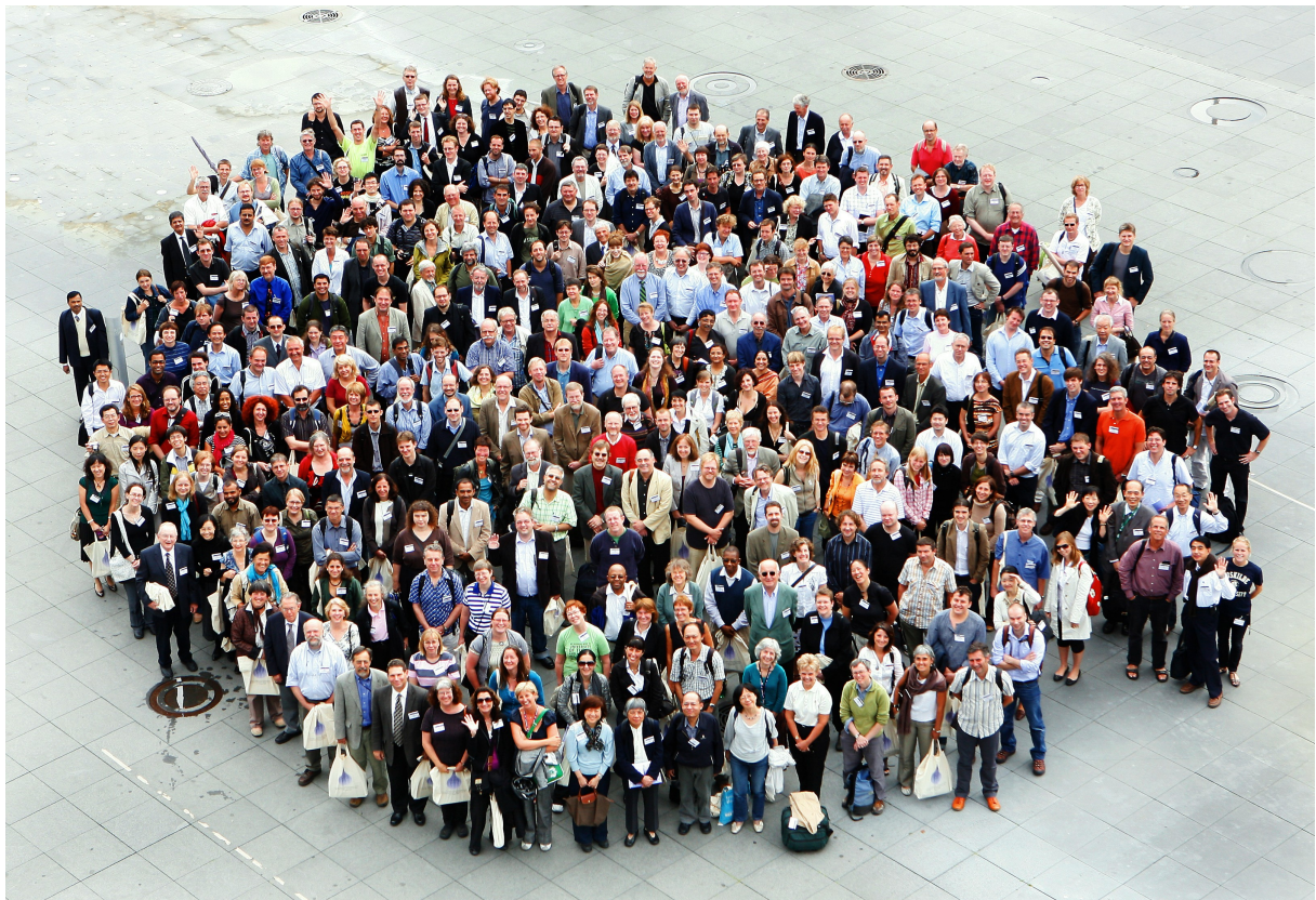
Photo des participants prise après la séance inaugurale du WCEH, 4 août 2009.